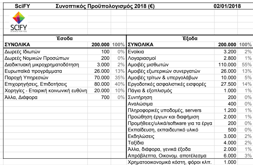
SciFY Κατανομή προϋπολογισμένων εσόδων 2018 (200.000€)